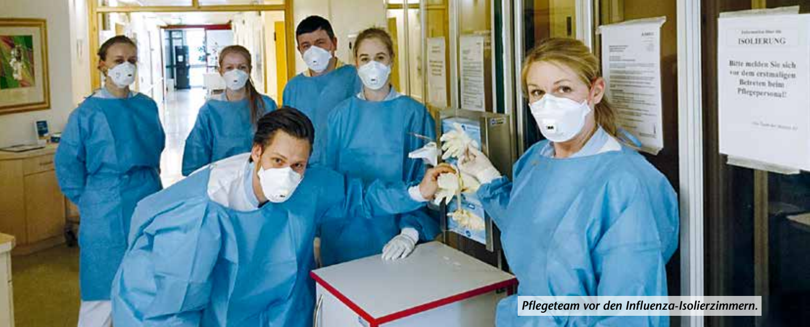
Pflegeteam vor den Influenza-Isolierzimmern.