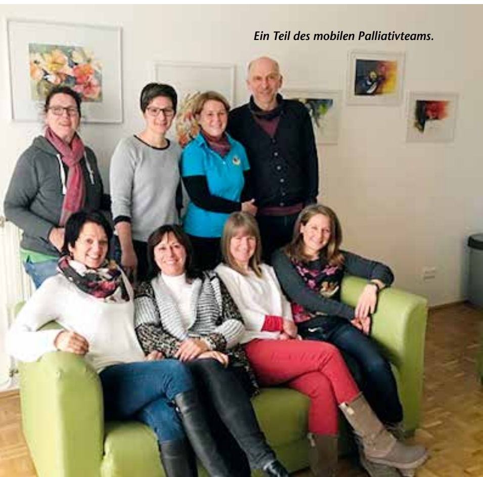
Ein Teil des mobilen Palliativteams.